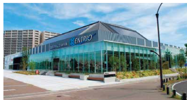
豊田合成記念体育館(エントリオ)

エントリオ:「しごと」「地域」「スポーツ」の三つの縁(エン)を大切に、お互いを支援(エン)し、共に発展していこうと、三重奏の「トリオ」を付けて命名されました。