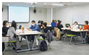
はたらくママパパ交流会 (育児と仕事の両立の支援)