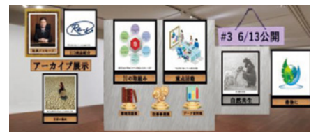
環境月間(バーチャル環境展示会)