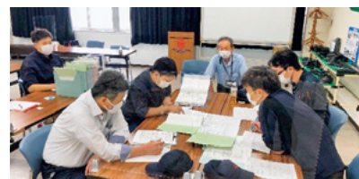
内部環境審査/豊田合成日乃出(株)