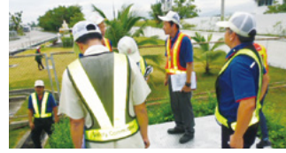
豊田合成タイランド(株)

当社独自で設定した環境マネジメントシステムの基準である「TG グローバルEMS」に基づいて毎年自主点検と不具合の是正を行い、継続的な改善活動を実施しています。