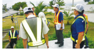
豊田合成タイランド(株)

当社独自で設定した環境マネジメントシステムの基準である「TG グローバルEMS」に基づいて毎年自主点検と不具合の是正を行い、継続的な改善活動を実施しています。