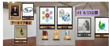
環境月間(バーチャル環境展示会)