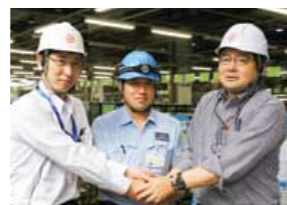
安心宣言が完了した係長に対し社長が、ねぎらいを表明するとともに活動継続を約束するために握手

継続的に改善ができる職場風土の醸成と、強い製造現場づくりをねらいに、2012年から「人づくり」「工程づくり」の両軸で品質向上に向けた活動を行っています。2016年度にはオペレータ目線に立った活動や、各工程の品質レベルに応じた目標を設定し、達成したら次の目標に向かってスパイラルアップする活動を開始しました。係単位で、やりやすい作業や品質不具合を改善し、クレーム「0」が達成できた段階で「安心宣言」し、担当役員が現地で改善内容をチェック。社長や担当役員が製造現場の責任者である係長と握手し「安心宣言」を約束します。