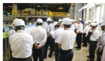
社長による現地確認