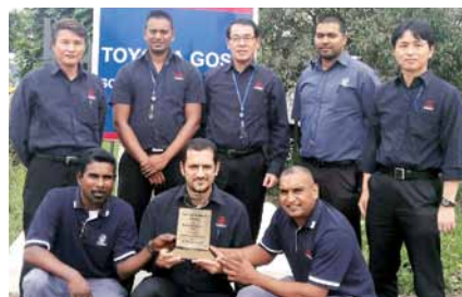
豊田合成南アフリカ(株)が南アフリカトヨタ自動車(株)からSupplier Superior Award in Quality Managementを受賞