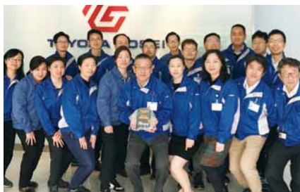
豊田合成(張家港)科技有限公司が广汽トヨタ自動車有限会社から品質優良賞を受賞