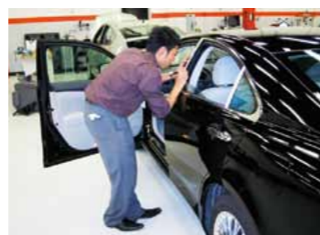
市場での信頼性向上活動

基づく的確な再発防止策を自動車メーカーの品質部門とともに講じ、以降の製品の品質不具合を未然に防止しています。