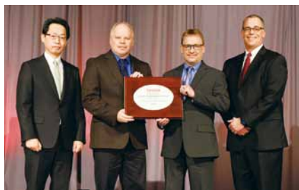
TGフルイドシステムズUSA(株)がトヨタモーターノースアメリカ(株)からExcellent Quality Performance Awardを受賞