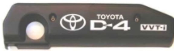
写真—2 エンジンカバー