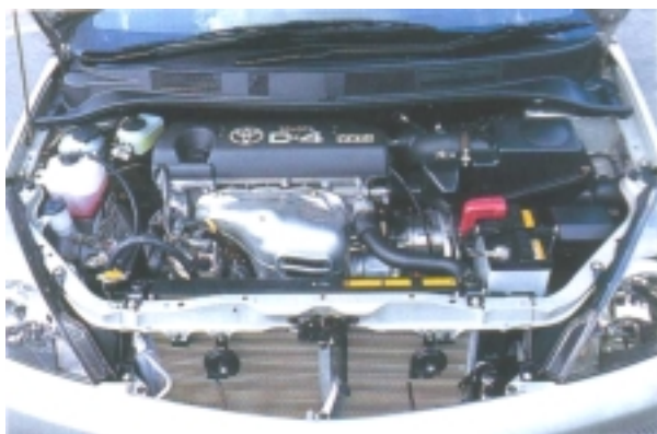
写真—1 車両搭載状態