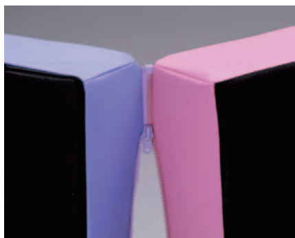
写真-2 ファスナー接続状態