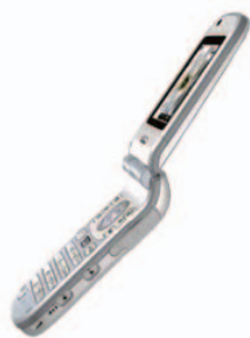
写真-3. 側面視 (S字デザイン)

『SA700iS』は、内蔵アンテナを採用することにより、オープン時の側面視の滑らかな曲線美のS字ラインが特徴的である（写真-3）。