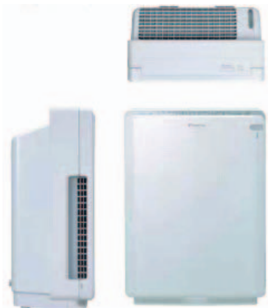
写真-1 '07モデル空気清浄機