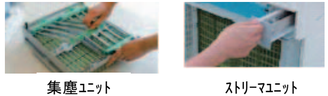
写真-4 メンテ部品の一例

ユーザがお手入れをする部品をユニット化し脱着操作性、拭取り易さを重点的に改善した。（写真-4）