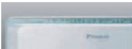
写真-3 表示・操作部

'07モデルより本体を床置き可能にしている。（前年までは全て卓上タイプ）その関係から表示・操作部を製品上部に設定することでユーザの使い勝手向上を図った。設計のポイントは電装品の配置、組立性に重点を置いた。（写真-3）