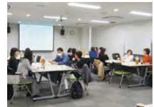
はたらくママパパ交流会 (育児と仕事の両立の支援)