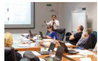
海外ミドルマネジメント研修