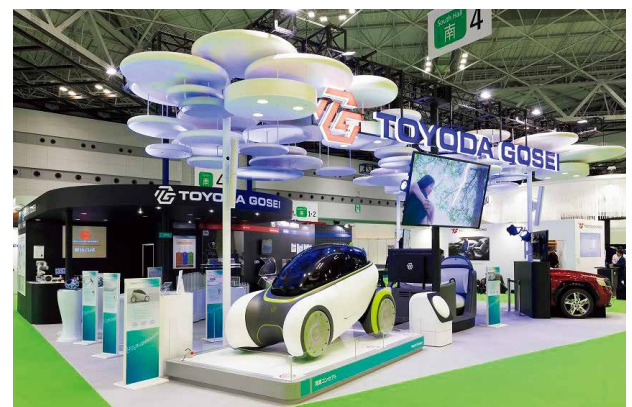
東京モーターショー2019当社ブース