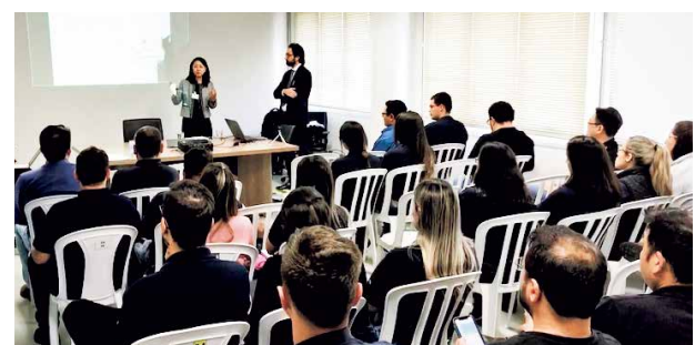
コンプライアンス研修（海外グループ会社）

当社では、グローバルで透明かつ健全な事業活動を推進するための共通の指針として、「グローバル贈収賄防止ガイドライン」を策定し、当社グループ全体での贈収賄の未然防止に取り組んでいます。また、階層別・リスク別研修などを通じて、従業員への継続的な啓発活動を行っています。