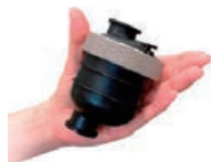
UV-C LED小型水浄化ユニット 省エネに貢献してきたLED技術を応用し空気・表面除菌、水浄化の実現により衛生面にも貢献