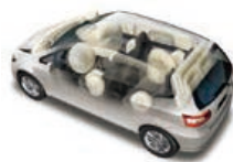
セーフティシステム製品(各種エアバッグなど) 交通事故死傷者数の減少にグローバルで貢献