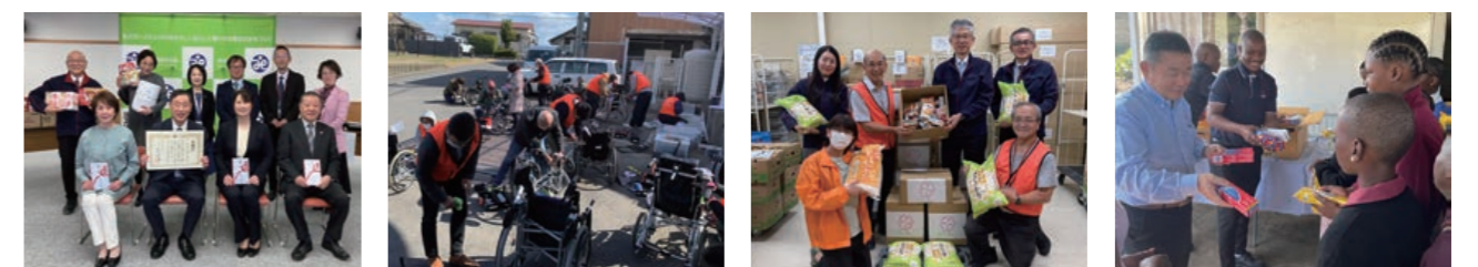
地域子ども食堂への支援

今後も社内で社会貢献活動への参加機会を増やすとともに、地域のためになる活動を推進していきます。