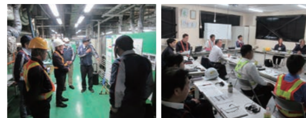
国内子会社の現地現物現認・指導

2023年度も各社の自主評価結果をふまえた統一強化項目を設定し、国内子会社に対しては、各3回/年(13社:計39回)の現地現物現認による監査・支援を行っています。