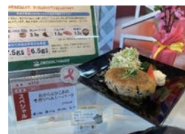
ピンクリボンランチ一例