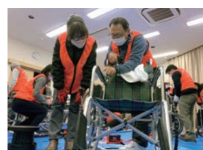
車イスドクターズ修理のようす