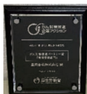
がん対策推進パートナー賞「情報提供部門」受賞楯

対策企業アクションより、がん対策推進パートナー賞(情報提供部門)を受賞しました。