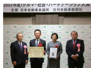
車イスドクターズCSP大賞授賞式