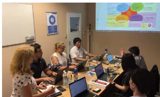
'24年7月欧州での会議の様子

今後も各地域に合わせた方法で連携を実施し、調達機能の向上、サステナビリティ活動の浸透、現地サプライヤーとの取り組み強化を図っていきます。