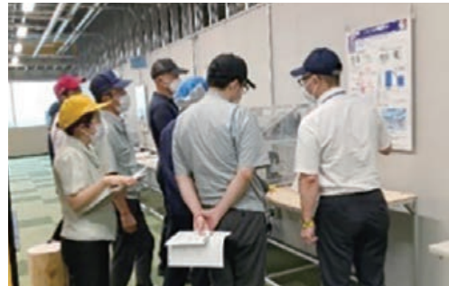
省エネ道場見学 (100社400名以上来場)

その取り組みの一環として、「カーボンニュートラル活動促進会」を年2回開催する中で、サプライヤー同士のグループ討議による情報共有・困りごと解決も実施しています。また、24年度からは日本の取り組みのグローバル展開を開始しており、今後もサプライチェーン全体で脱炭素に向けて取り組んでまいります。