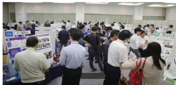
24年度勝ち技展示会

また、さらに協業の密度とスピードアップを図るため、2023年より当社の困りごと(ニーズ)、協和会の提案(シーズ)の情報共有により、双方の力を活かした取り組みを開始しており、24年度の勝ち技展示会ではサプライヤー間も含めた協業成果を多く展示できました。