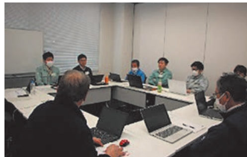
カーボンニュートラル活動促進会でのグループ討議