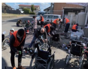
車イスドクターズ