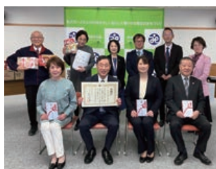
地域子ども食堂への支援

今後も社内で社会貢献活動への参加機会を増やすとともに、地域のためになる活動を推進していきます。