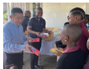
地元児童養護施設への寄贈 (豊田合成南アフリカ(株))