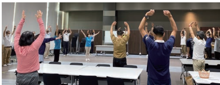
55歳健康教育の様子

また、65歳までの定年延長を受け、55歳時に実施する“キャリアデザイン研修”にて体力測定と運動習慣に関する教育を実施し、年齢を重ねても元気な体で働くための支援を行っています。